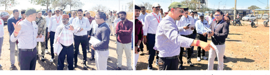
हरिभूमि न्यूज़ अशोकनगर

अशोकनगर जिले में स्थित म.प्र.तीर्थ स्थल मां जानकी मंदिर करीला धाम पर 07 मार्च से 09 मार्च 2026 तीन दिवसीय मेला शनिवार से प्रारंभ होगा। करीला मेला में श्रद्धालुओं के लिए आस्था के केंद्र पर जिला प्रशासन द्वारा व्यापक रूप से सभी आवश्यक तैयारियां एवं व्यवस्थाएं की गई हैं।