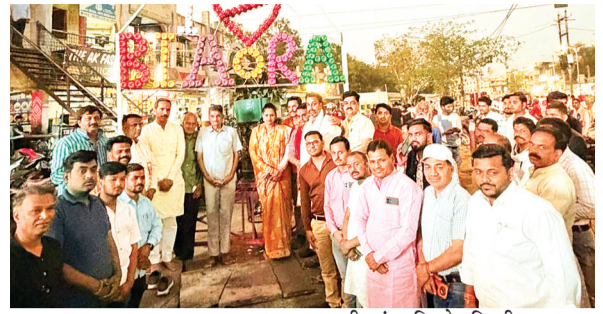
हरिभूमि न्यूज ▶▶ ब्यावरा