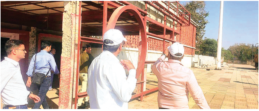
हरिभूमि न्यूज़ अशोकनगर

भारत सरकार की अमृत-2 योजना में अशोकनगर रेलवे स्टेशन को शामिल किया गया था। लेकिन इस स्टेशन पर चल रहे निर्माण कार्य आज दिनांक तक पूरे नहीं हो पाए हैं। इसके पहले भी आए अधिकारियों ने नाराजगी जताई थी। शुक्रवार को भोपाल डीआरएम ने निर्माण कार्य समय पर पूर्ण नहीं होने पर नाराजगी जताई। डीआरएम के आगमन की जानकारी मिलने के बाद जनप्रतिनिधि रेलवे स्टेशन पहुंचे और पानी से लेकर सुलभ कॉम्प्लेक्स जैसी कमियों से अवगत कराया।